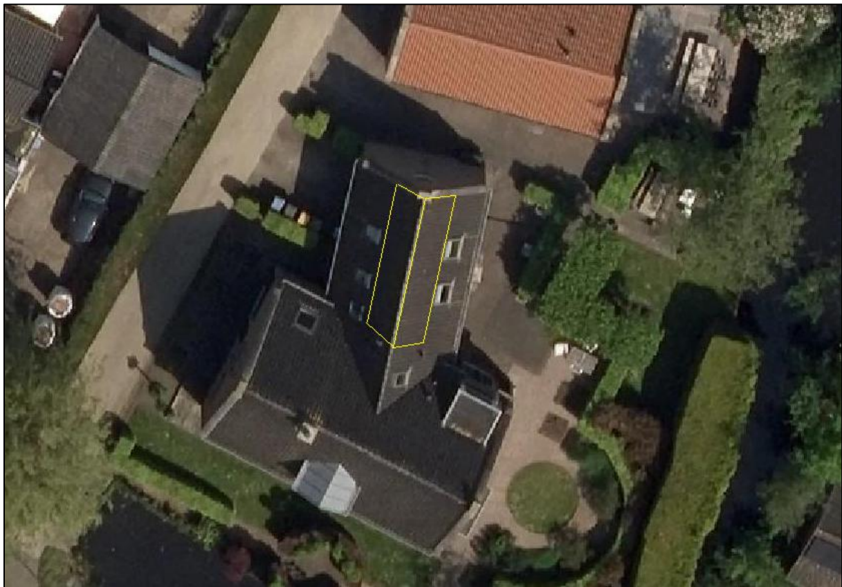
Figuur 1: Voorgestelde locatie zonnepanelen in oost-west opstelling